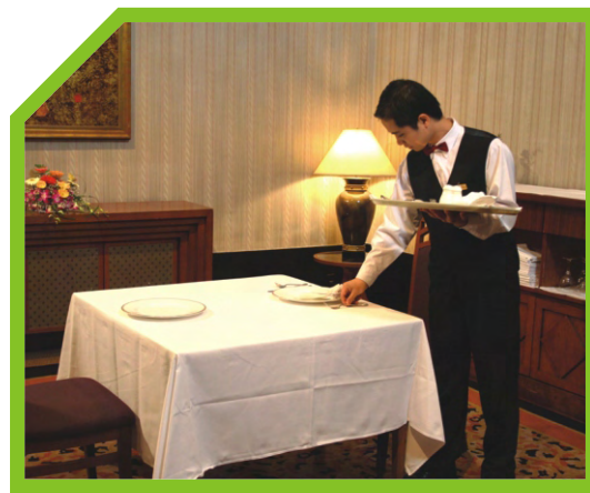
ĐẶT ĐĨA LỚN VÀ ĐĨA ĂN CÁ BÊN TRÁI ĐĨA 38