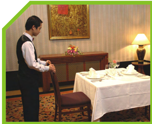
KIỂM TRA XEM ĐÃ ĐỦ TOÀN BỘ CÁC MÓN ĐỒ VÀ SẠCH CHỮA