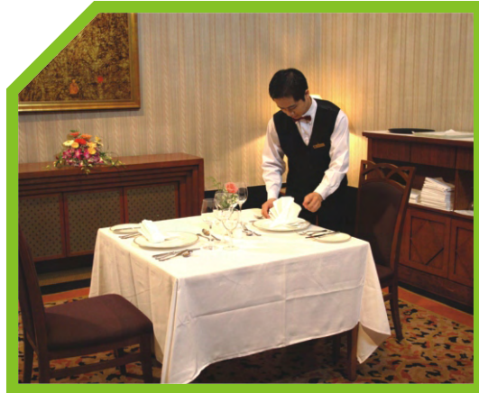
ĐẶT DAO LỚN, DAO ĂN CÁ VÀ THÌA ĂN SÚP BÊN PHẢI ĐĨA