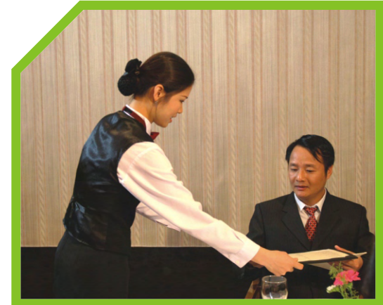
TRÌNH DANH MỤC RƯỢU