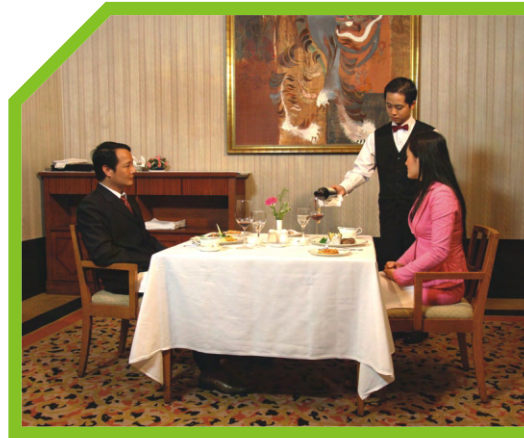
RÓT MỘT LƯỢNG NHỎ RƯỢU VANG CHO NGƯỜI CHỦ TIỆC ĐỂ THỬ