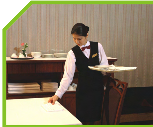
MỖI LẦN BÀY HOÀN THIỆN MỘT CHỖ 31