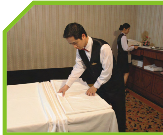
CHUẨN BỊ THAY KHĂN