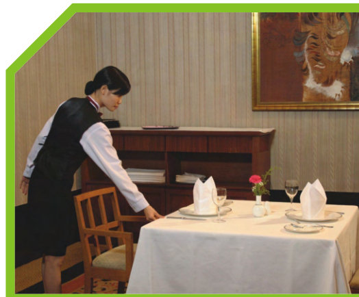
ĐỂ KHĂN ĂN LÊN ĐĨA ĐỊNH VỊ 34