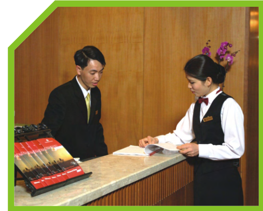
LIÊN LẠC VỚI NGƯỜI QUẢN LÝ NHÀ HÀNG 3