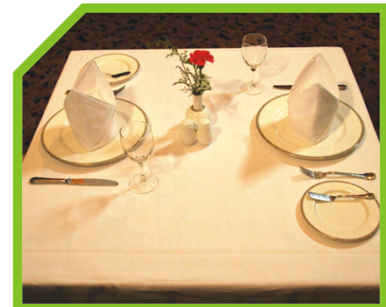
KIỂM TRA LẦN CUỐI TOÀN BỘ BÀN ĂN 35