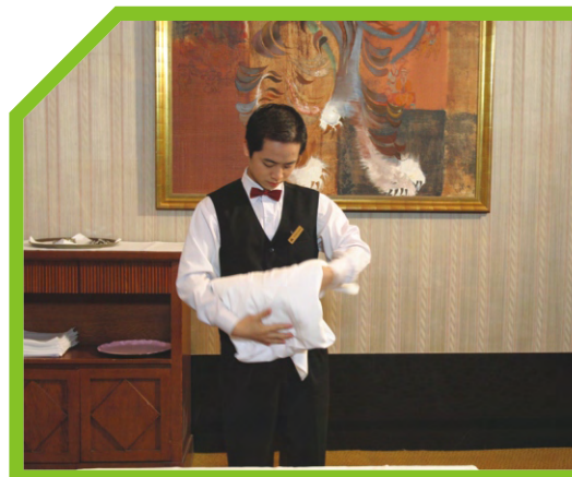
LOẠI BỎ KHĂN BÀN