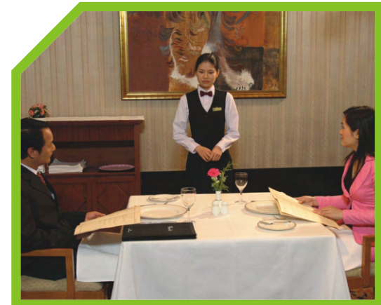
MỜI KHÁCH NGỒI 6