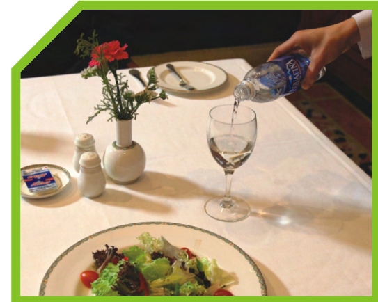
CHÚ Ý ĐẾN ĐỒ UỐNG