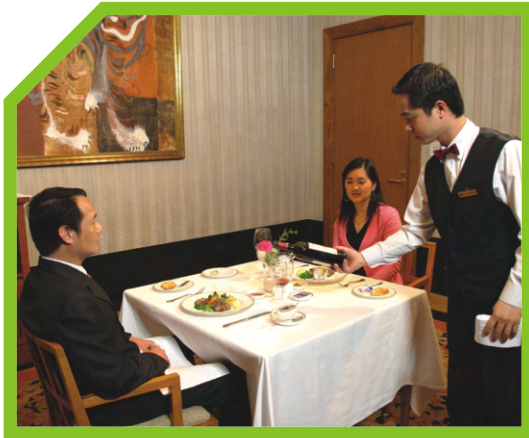
KIỂM TRA LẠI