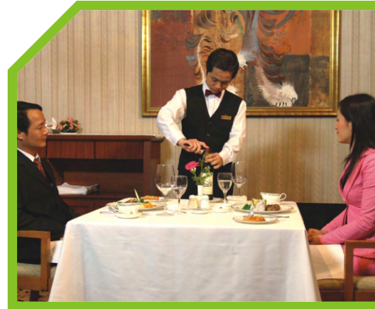
CẮT NẮP CHAI 2