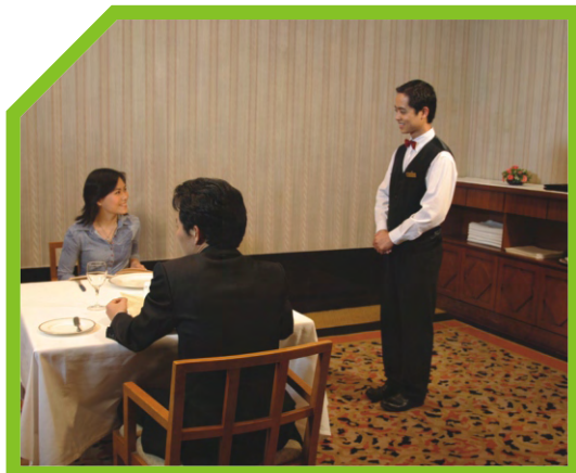
TẮM HÀNG NGÀY 4