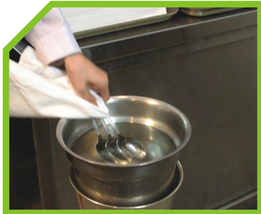
CHUẨN BỊ SẴN SÀNG NƯỚC NÓNG TRONG MỘT CHIẾC XÔ THÉP 1