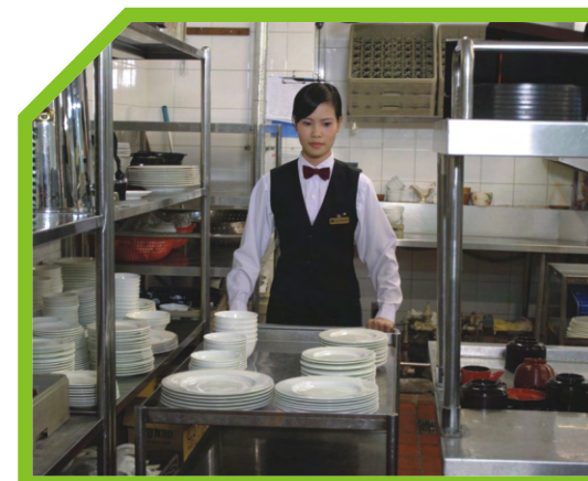
ĐỂ BÁT ĐĨA ĐÃ LAU BÓNG LÊN XE ĐẨY