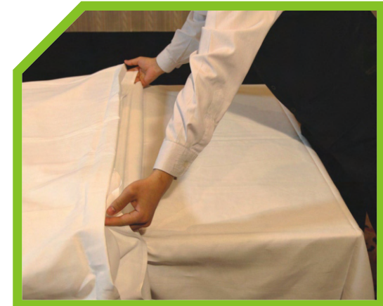
ĐẶT KHĂN SẠCH CÒN GẤP LÊN BÀN