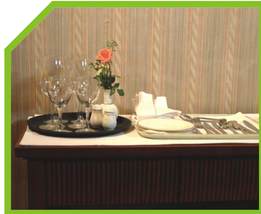
CHUẨN BỊ CÁC THIẾT BỊ BÀY BÀN ĐỂ MANG ĐI TRÊN KHAY PHỤC VỤ 36