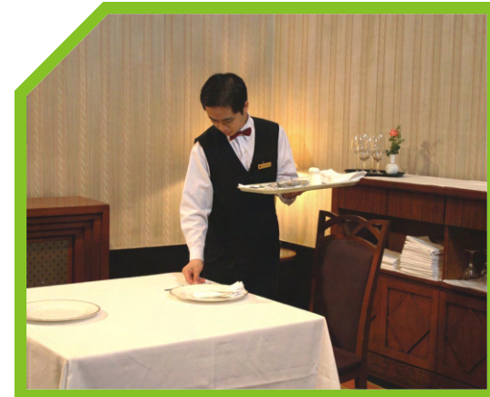
ĐẶT ĐĨA ĐỊNH VỊ LÊN BÀN PHỦ KHĂN SẠCH 37