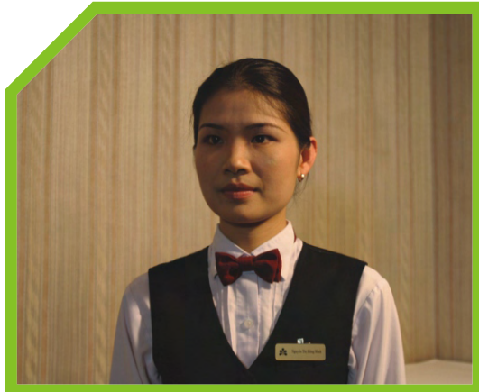
TRANG PHỤC VÀ VỆ SINH CÁ NHÂN 1