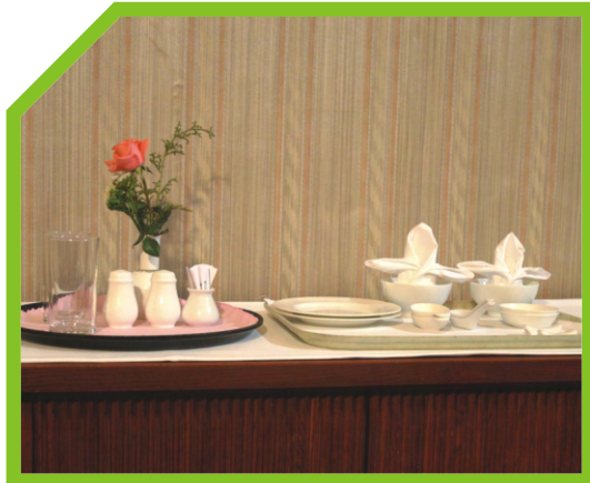
CHUẨN BỊ CÁC THIẾT BỊ CẦN THIẾT 44