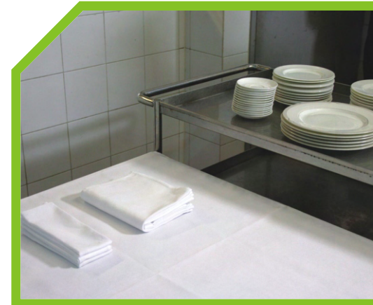
LẤY BÁT ĐĨA ĐỂ LAU BÓNG