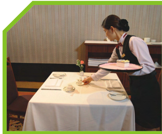
KIỂM TRA BÀN ĂN LẦN CUỐI 54