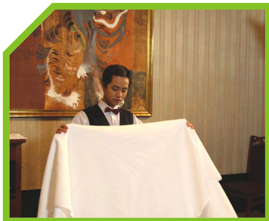
MỜ KHĂN SẠCH