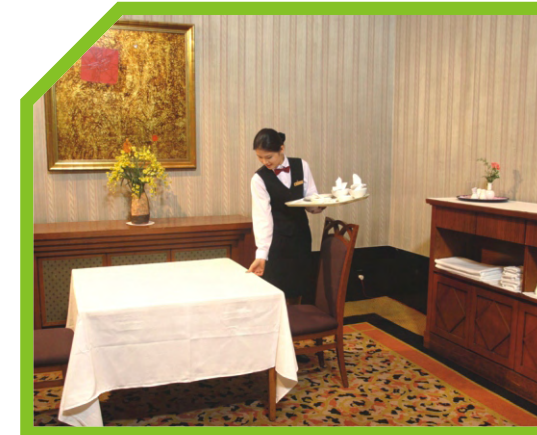
BÀY BÀN, KHĂN PHỦ BÀN PHẢI SẠCH 46