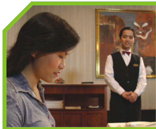
TAY SẠCH SẼ 5