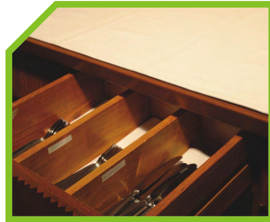
KIỂM TRA ĐỦ ĐAO DĨA ĐÃ LAU BÓNG TRONG MỖI NGĂN KÉO