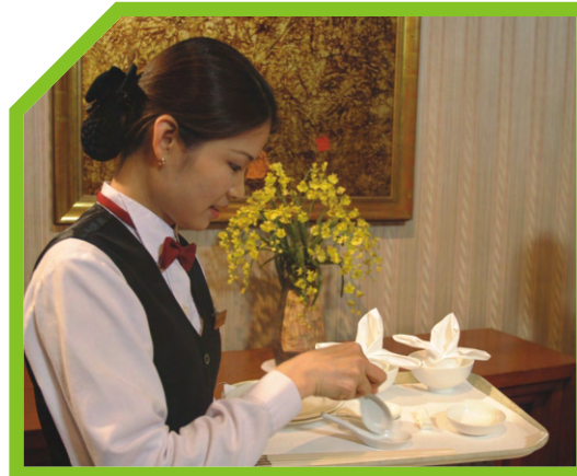
BÀY KHĂN ĂN ĐÃ GẤP BÊN TRONG BÁT 45