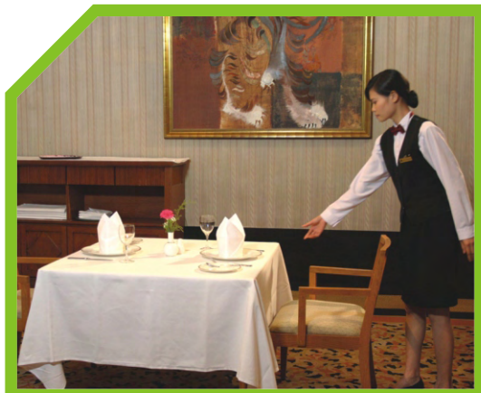
ĐẶT LY CỐC CÁCH 2CM PHÍA TRÊN MŨI DAO 33