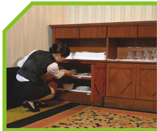
KIỂM TRA ĐỦ SỐ LƯỢNG BÁT DĨA VÀ CỐC