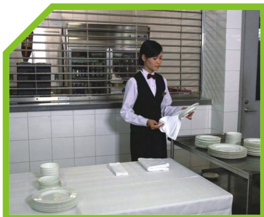
LAU BÓNG BÁT ĐĨA