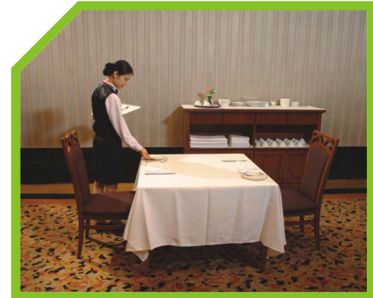
MỖI LẦN BÀY HOÀN THIỆN LUÔN MỘT CHỖ 52