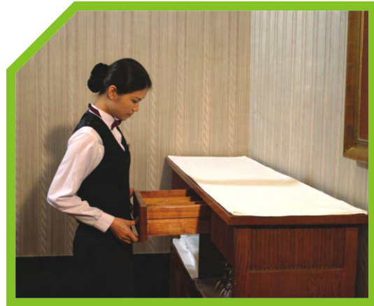
DỌN SẠCH QUẦY PHỤC VỤ