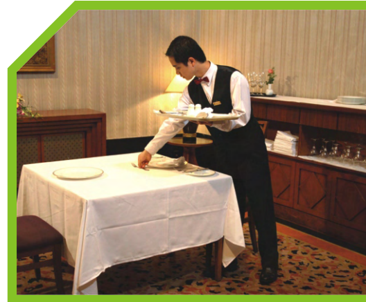
ĐẶT THÌA VÀ ĐĨA ĂN TRÁNG MIỆNG PHÍA TRÊN VỊ TRÍ BỘ ĐỒ ĂN