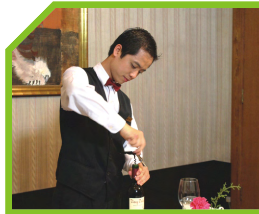
KÉO NÚT CHAI RA 4