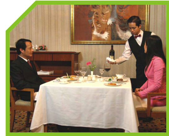
RÓT RƯỢU CHO CÁC VỊ KHÁCH KHÁC