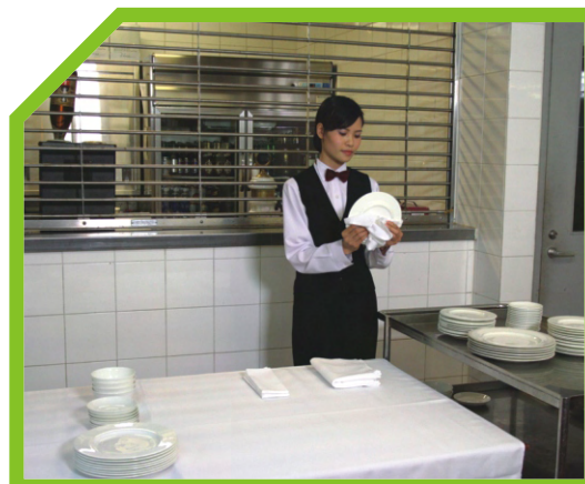
BÁT ĐĨA PHẢI SÁNG BÓNG VÀ KHÔNG CÓ ĐÓM, VẾT TRÊN CẢ HAI MẶT