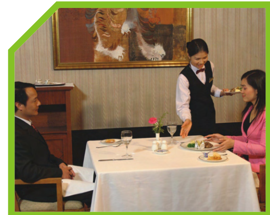
PHỤC VỤ CÁC MÓN CHÍNH