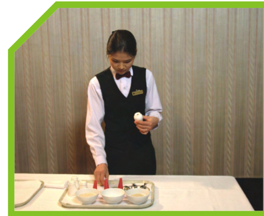
KIỂM TRA BỀ NGOÀI CỦA CÁC KHAY ĐỰNG ĐỒ GIA VỊ 29