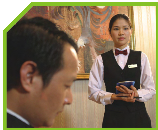
GHI YÊU CẦU ĐỒ UỐNG 3