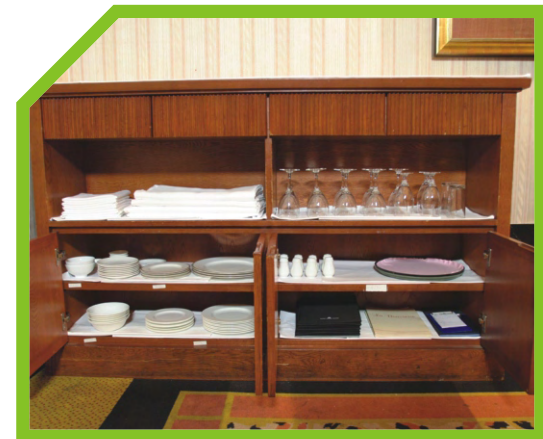
KIỂM TRA ĐỦ SỐ LƯỢNG ĐỒ VẢI ĐỂ PHỤC VỤ