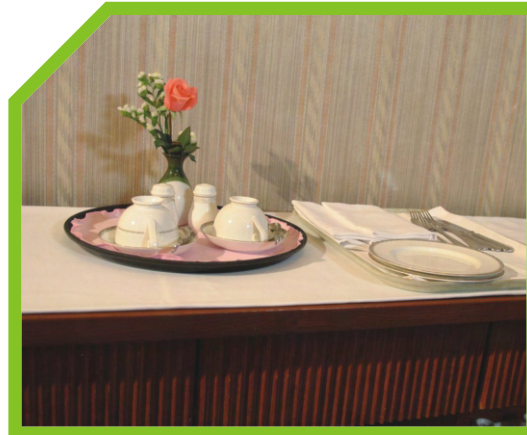
CHUẨN BỊ CÁC DỤNG CỤ CẦN THIẾT 51