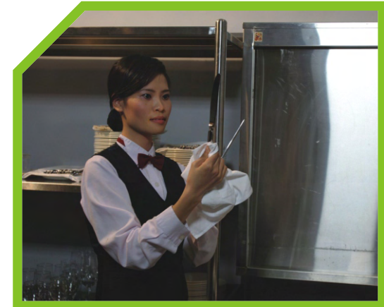
DÙNG KHĂN LAU BÓNG DAO DĨA 3