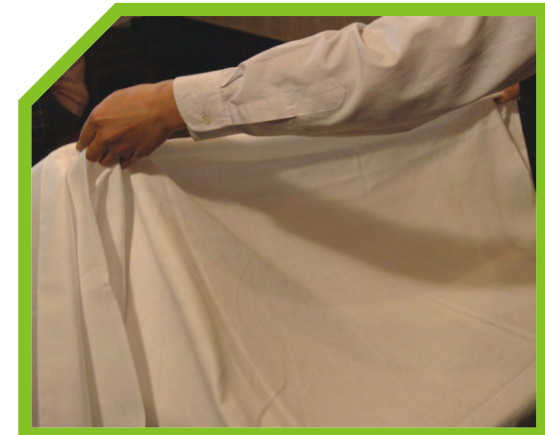
KÉO MẶT TRÁI CỦA KHĂN BÀN