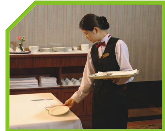
CẢ ĐĨA VÀ DAO ĐĨA PHẢI CÁCH MÉP BÀN 2CM 32