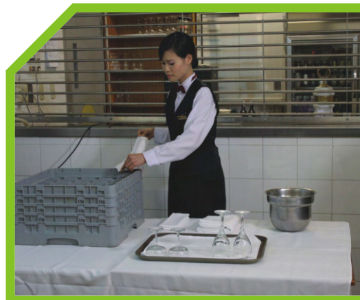
LẤY LY CỐC ĐỂ LAU BÓNG 5