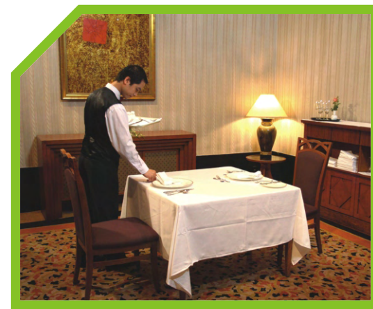
CẢ ĐĨA VÀ DAO ĐĨA PHẢI CÁCH MÉP BÀN 2CM 39