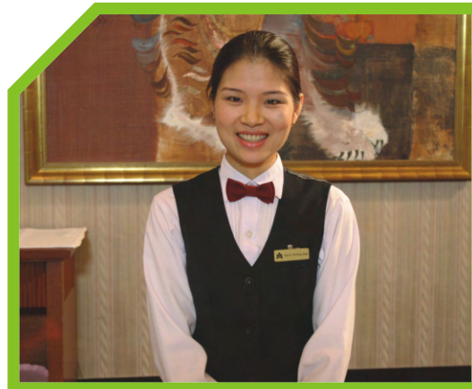
CHÀO KHÁCH 5