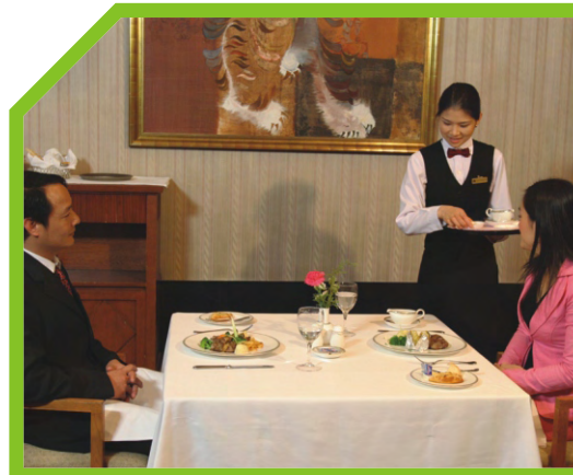
PHỤC VỤ CÁC MÓN ĂN KÈM