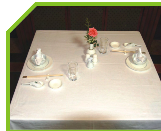
KIỂM TRA LẦN CUỐI TOÀN BỘ BÀN ĂN 49