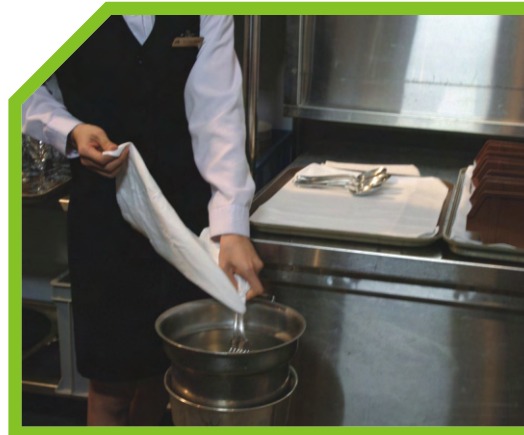
NHÚNG DAO DĨA VÀO NƯỚC 2