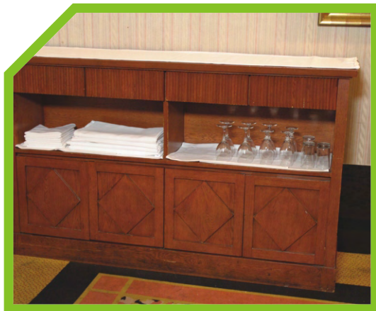
KIỂM TRA ĐỂ ĐẢM BẢO MỌI THỨ CẦN THIẾT ĐÃ SẴN SÀNG