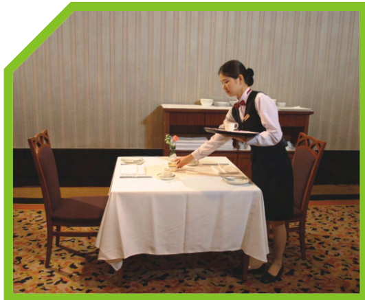
BÀY CÁC ĐỒ BỔ SUNG KHÁC, BÁT DỪNG ĐƯỜNG VÀ BÌNH ĐỰNG SỮA 53