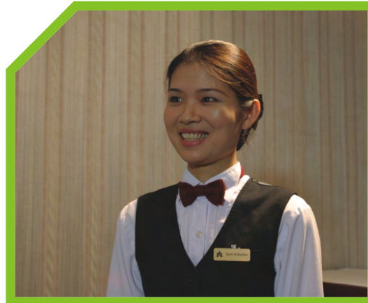
BUỘC TÓC SAU GÁY (NỮ) 2