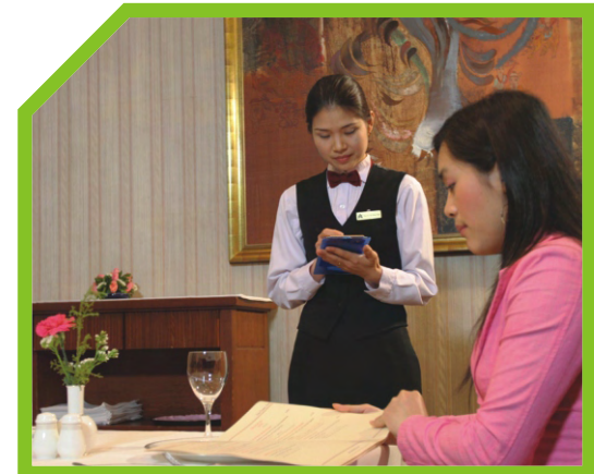
GHI YÊU CẦU CỦA KHÁCH THEO THỨ TỰ THÔNG THƯỜNG (NỮ GIỚI, NAM GIỚI, NGƯỜI MỜI)