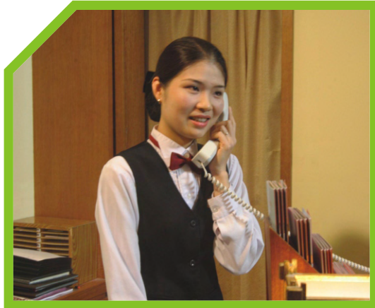
NHẮC ĐIỆN THOẠI VÀ LẮNG NGHE YÊU CẦU ĐẶT BÀN CỦA KHÁCH 1