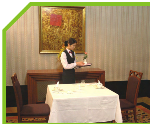
ĐỂ ĐŨA BÊN TRÊN GÁC ĐŨA, CÁCH BÊN PHẢI CỦA BÁT 4CM 48