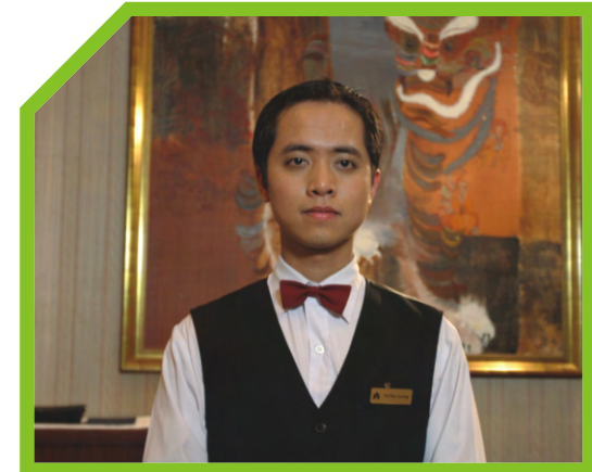
TÓC CẮT NGẮN, CẠO RÂU GỌN GÀNG (NAM) 3