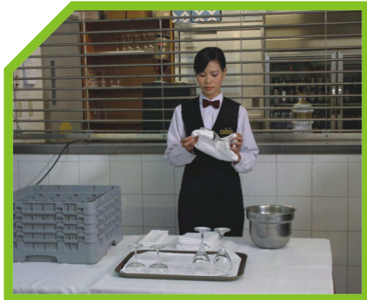
KIỂM TRA LY CỐC