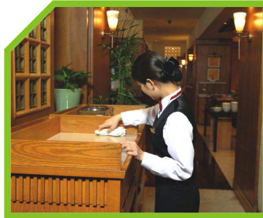
KẾT THÚC VIỆC ĐẶT BÀN 2