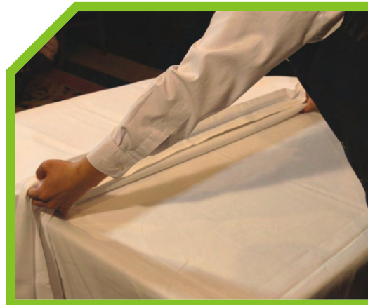
GIỮ NGUYÊN KHĂN BÀN ĐÃ GẤP