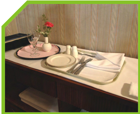
CHUẨN BỊ CÁC THIẾT BỊ BÀY BÀN TRÊN KHAY PHỤC VỤ 30