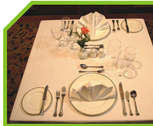
BÀY BÀN ĂN THEO KIỂU ĐẶT TRƯỚC