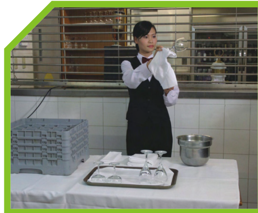
ĐỂ LY CỐC LÊN KHAY HOẶC GIÁ ĐỠ