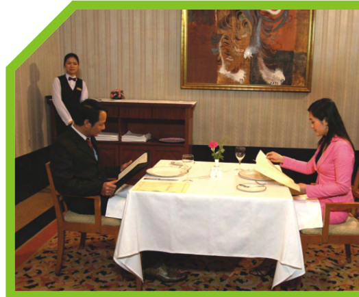
ĐƯA THỰC ĐƠN CHO TỪNG NGƯỜI KHÁCH