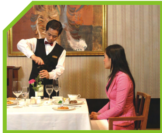
CẦM DÂY XOẮN CỦA DỤNG CỤ MỞ CHAI 3