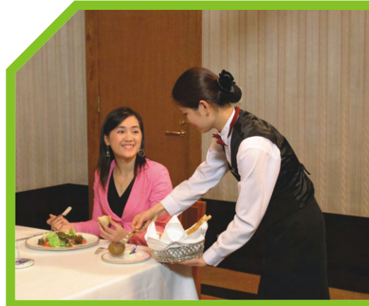
CUNG CẤP THÊM BÁNH MÌ