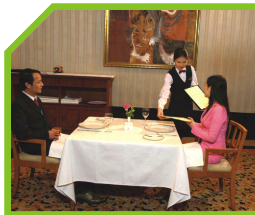
THU LẠI THỰC ĐƠN 4