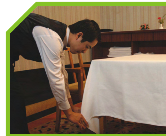
KIỂM TRA LẠI KHĂN MỚI VÀ CHỈNH SỬA LẠI NẾU CẦN