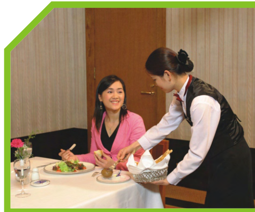
PHỤC VỤ BÁNH MÌ