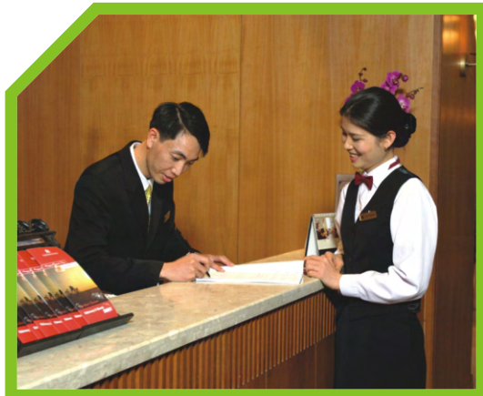
CẦN CỐ SỰ CHUẨN BỊ CHO NHỮNG BUỔI TIỆC ĐẶC BIỆT HAY KHÁCH VIP 4