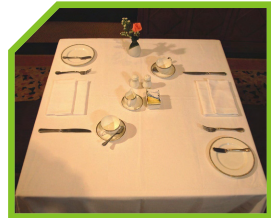
BÀY BÀN ĂN BỮA SÁNG 55