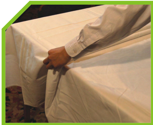
TRẢI NẾP GẤP XA ĐỂ PHỦ MÉP XA CỦA BÀN