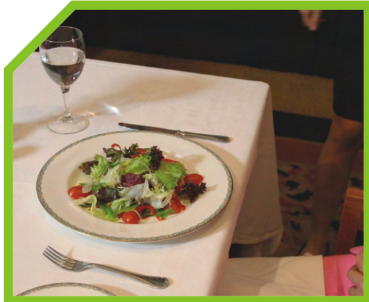
PHỤC VỤ MÓN KHAI VỊ