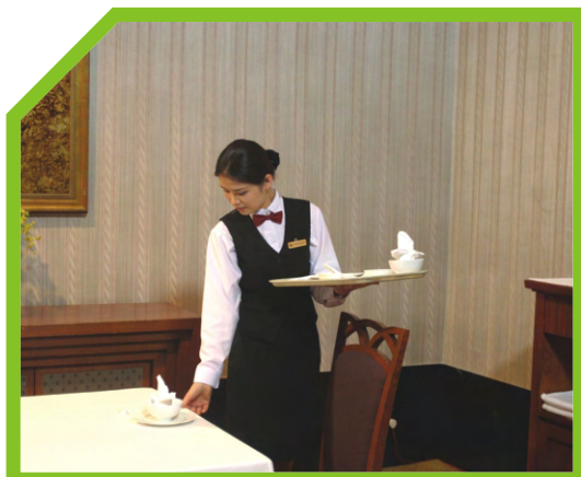
ĐỂ BÁT ĐĨA ĂN Ở GIỮA ĐĨA LÓT 47