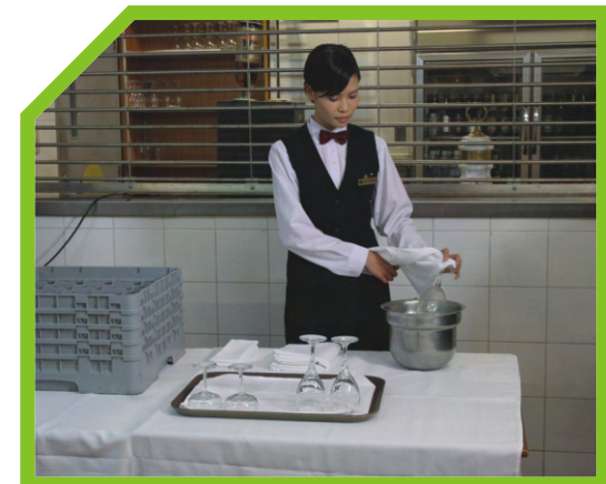
LAU BÓNG LY CỐC 6