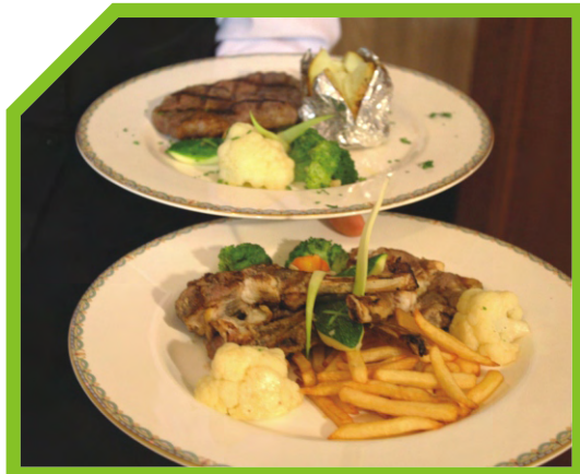
LẤY CÁC MÓN CHÍNH