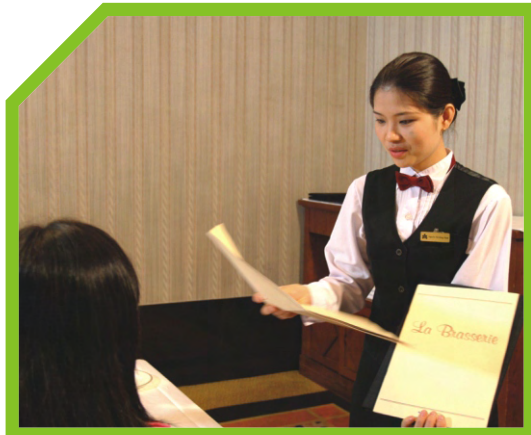
THÔNG BÁO CHI TIẾT THỰC ĐƠN HOẶC GIỚI THIỆU MÓN ĂN