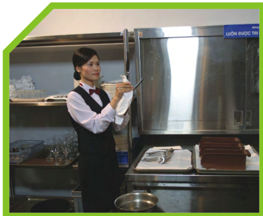
ĐẶT DAO DĨA ĐÃ LAU BÓNG VÀO KHAY 4