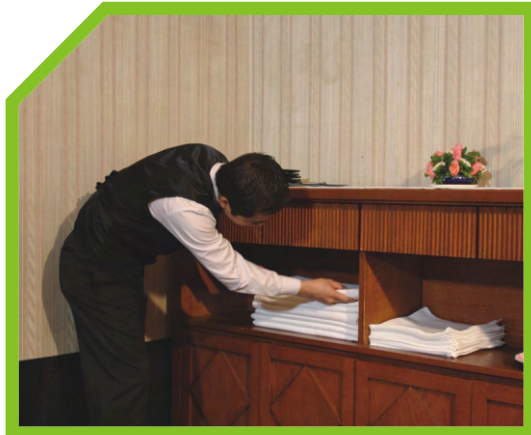
LỰA CHỌN KHĂN