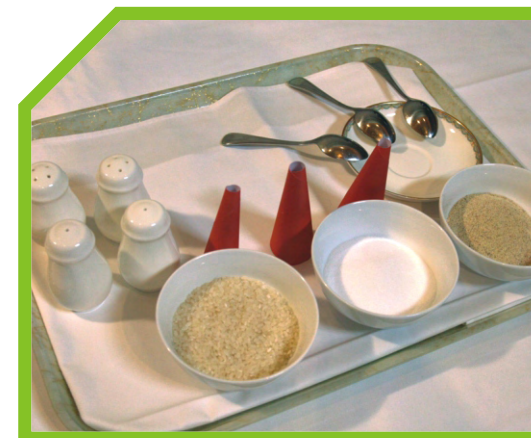
SẮP XẾP DỤNG CỤ