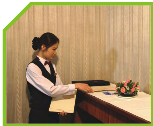
CHUẨN BỊ PHIẾU YÊU CẦU VÀ BÚT 1