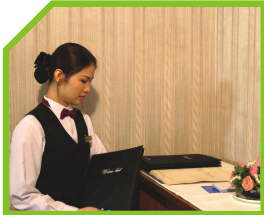
LỰA CHỌN THỰC ĐƠN VÀ DANH MỤC RƯỢU