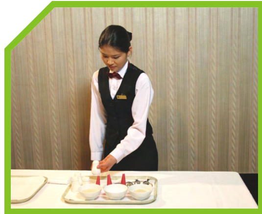
KIỂM TRA ĐỒ DÙNG BÊN TRONG 25