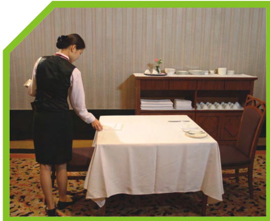
ĐẶT KHĂN ĂN GỌN GÀNG TRÊN BÀN 50