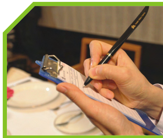
GHI YÊU CẦU 2